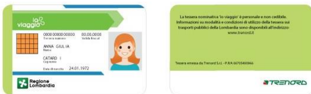
Tessera IO VIAGGIO (con logo Trenord) - nuovo layout

Qualora il Cliente Trenord fosse impossibilitato ad effettuare la visita prenotata dovrà darne comunicazione via mail a prenotazionemostralecco@gmail.com il prima possibile e comunque prima della data concordata.